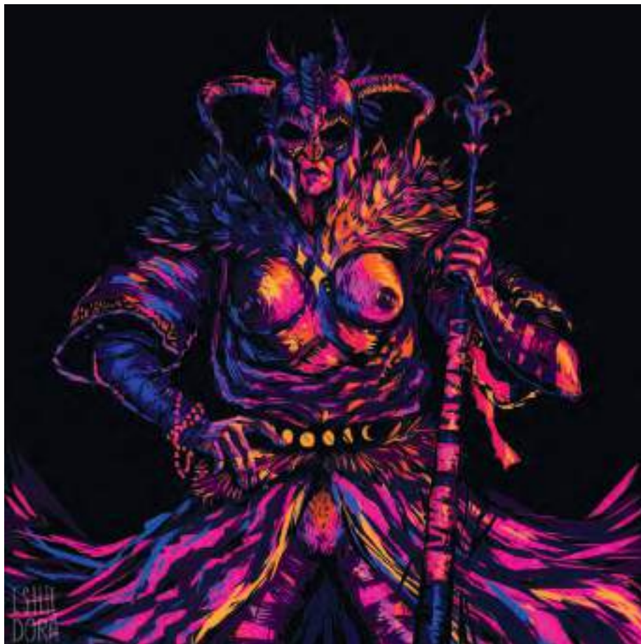
Isidora Avramović (druga godina), Umjetnost u prostoru, Pronađi sebe