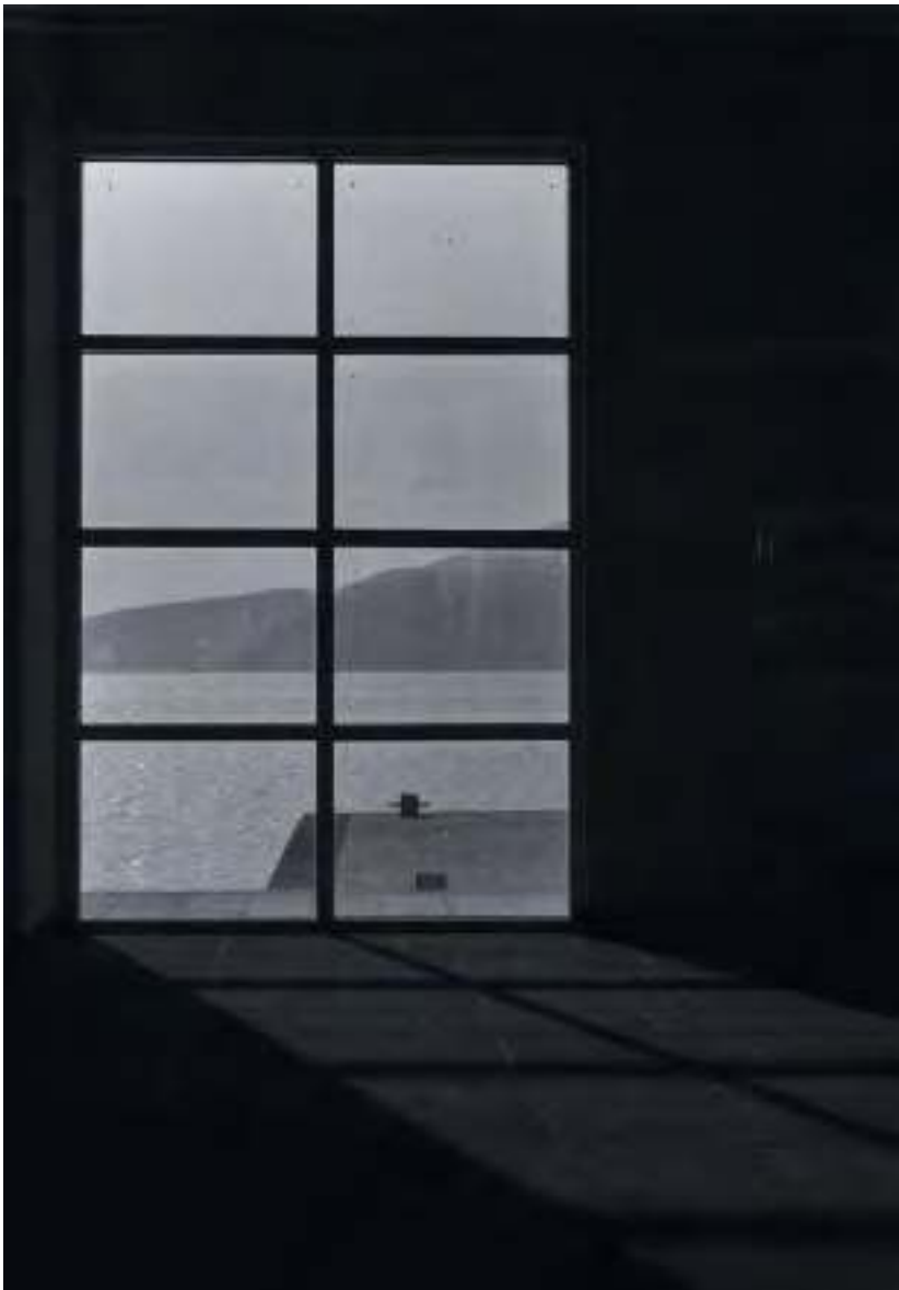
Mia Antunović ( treća godina ), Fotografija