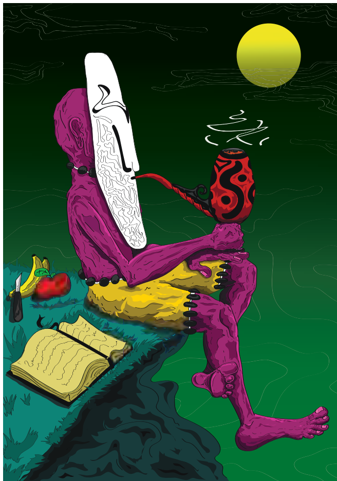
Jevrem Bojović ( druga godina ), Umjetnost u prostoru, Pronađi sebe