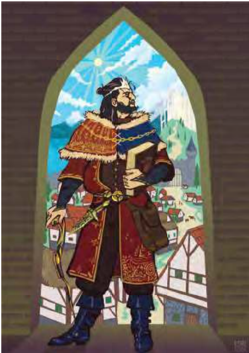
Isidora Avramović ( druga godina ), Digitalno slikanje, karakter